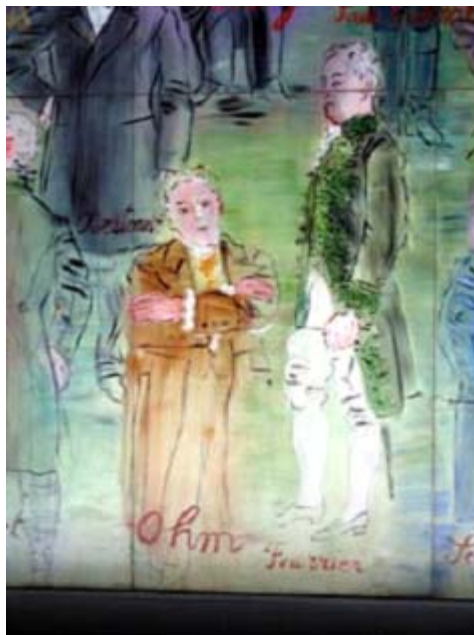
Figure 1 : à droite, Joseph Fourier [sic], en habit d'académicien. Joseph Fourier (1768 - 1830) a été Secrétaire perpétuel de l'Académie des sciences de 1821 jusqu'à sa mort en 1830. Détail de La Fée Electricité, Raoul Dufy (Palais de Chaillot, 1937).

Lorsqu'on veut déterminer les lois du mouvement de la chaleur dans une barre hétérogène (...)