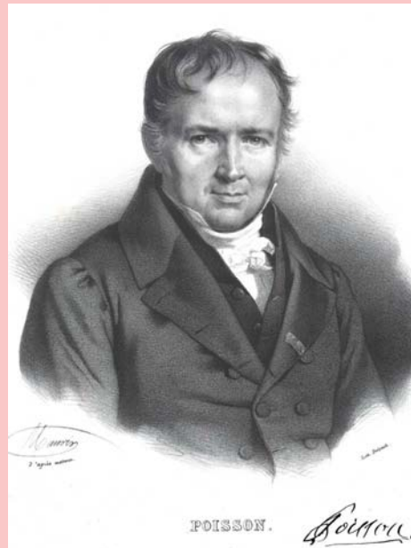
Figure 3 : Siméon- Denis Poisson (1781-1840)

D'où viennent de telles relations ? De deux choses :