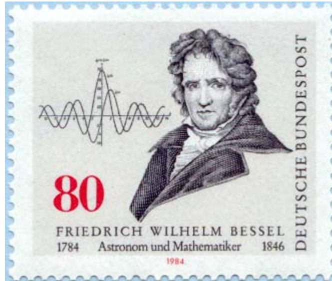
Figure 2 : Timbre allemand émis en 1984 à l'occasion du bicentenaire de la naissance de Wilhelm Bessel (1784-1846). À gauche, on reconnaît les deux premières fonctions de Bessel, J_0 (paire) et J_1 (impaire).